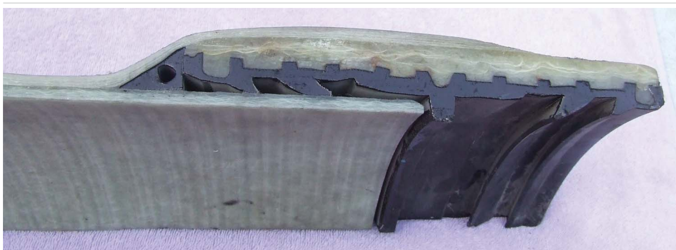
תמונה מס' 13 | חתך מחבר עפרה

המחברים מאפשרים סטייה זוויתית בין הצינורות בתחום של 3^\circ - 0.5^\circ כתלות בקוטר הצינור ולחץ העבודה. הסטייה הזוויתית בין הצינורות מאפשרת להניח צנרת בתעלה בעלת תוואי קשתי. הקטנת אורכי הצנרת תאפשר הקטנה נוספת של רדיוס תוואי הצינור.